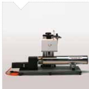
AR4 asse rotante con mandrino, portata massima 70 Kg diametro 125 mm