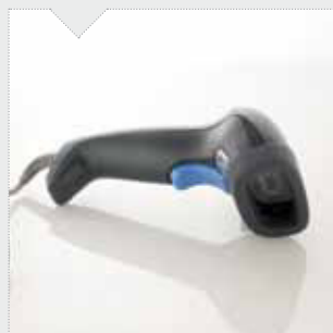
BC-DLC lettore bar-code per acquisizione codici da marcare