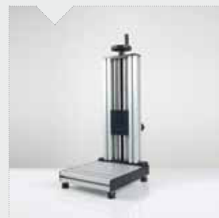
COLONNA modifiche personalizzate