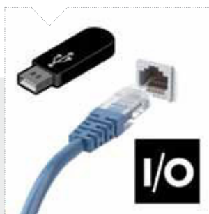
Porta Ethernet, USB, I/O