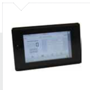
Pannello di programmazione touch-scren 7" integrato