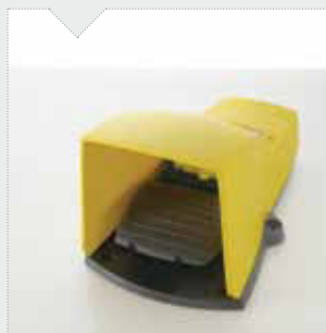
PDL-INT-01 pedale per comando di "start marcatura"