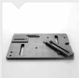
P-TARG piastra per fissaggio targhette metalliche