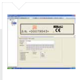
Software per PC Stamper 2.0