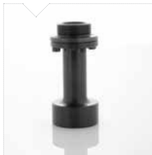
PRL-70 prolunga del punzone (+70 mm)